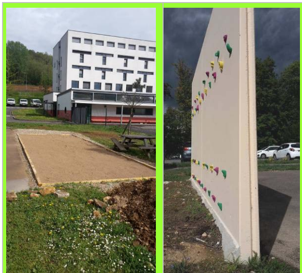
Le terrain pour jeu de boules à proximité du parcours d'escalade horizontale

• Enfin, un cadeau inespéré nous est arrivé du club Rotary Majorelle qui nous a offert le bénéfice d'une soirée dansante organisée à l'occasion de la Saint Patrick. Grâce à leur don, nous avons pu compléter le financement d'un grand terrain de pétanque , qui sera utilisé avec toutes sortes jeux de boules et de quilles.