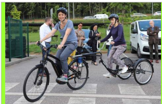
Un des deux vélos électriques de chez Moustache Bikes en pleine action