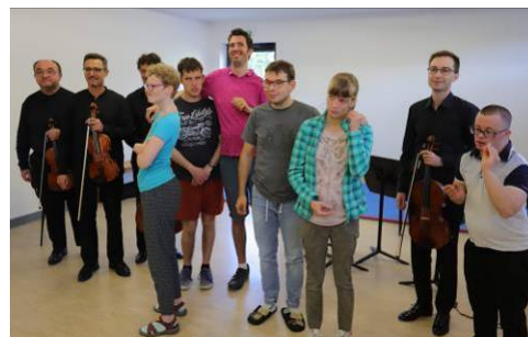
Pendant et après le concert

➤ En projet pour 2020 : mettre en place une activité d'initiation au golf, à Pulnoy et sur le site du FAM (selon la météo) avec l' association Albatros (Handi-sport).