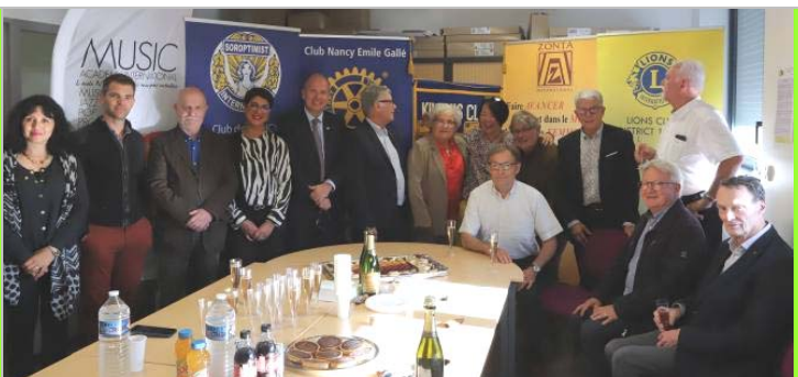
La petite réception avec nos sympathiques donateurs de l'Interclubs Service

• Enfin, un cadeau inespéré nous est arrivé du club Rotary Majorelle qui nous a offert le bénéfice d'une soirée dansante organisée à l'occasion de la Saint Patrick. Grâce à leur don, nous avons pu compléter le financement d'un grand terrain de pétanque , qui sera utilisé avec toutes sortes jeux de boules et de quilles.